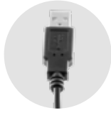
Tartozék USB kábel