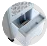
5 literes tartály