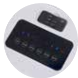
Vezérlő panel és távvezérlő