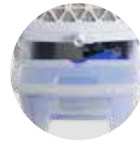
4 literes tartály