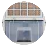
10 literes tartály