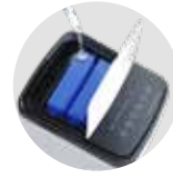
Felülről tölthető víztartály